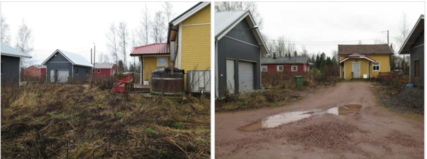
Mattilan Pihapiiri 2.12.2020. Harmaat ulkorakennuksia ja keltainen asuinrakennus.

Tämä asiakirja on hyväksytty sähköisesti Porin kaupungin asianhallintajärjestelmässä