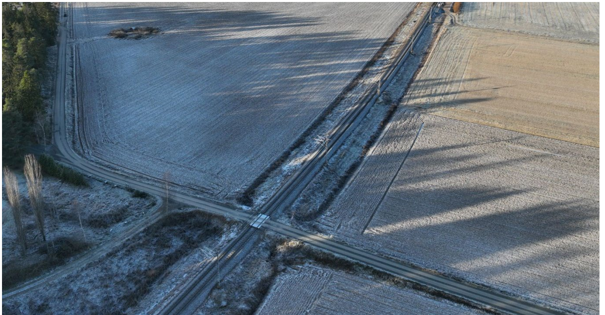
Ruhadentien tasoristeys joulukuussa 2025.

Nakkilan Masiantielle rakennetaan radan alittava silta, jonka kautta ajoneuvoliikenne pääsee jatkossa kulkemaan turvallisesti. Kuritun ja Ruhaden tasoristeykset poistetaan. Työt liittyvät Tampere-Pori tasoristeysten poisto ja parantaminen -hankkeeseen.