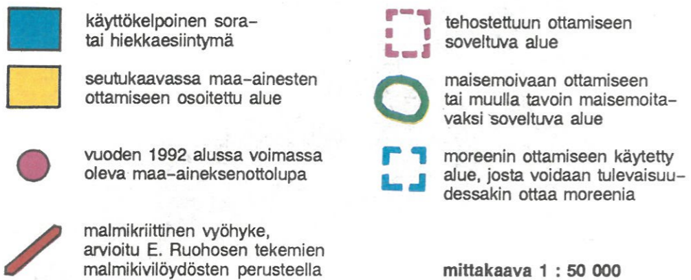
KUVA 4. MAA-AINEKSEN OTTAMISEEN KIINNOSTUSTA LISÄÄVÄT TEKIJÄT